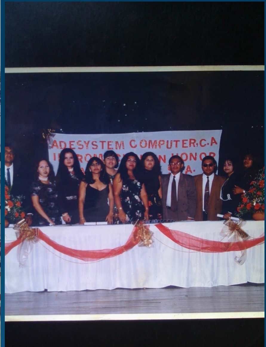
Proyecto como Emprendedor Centro de Capacitación Municipio Miranda Edo. Zulia 1.995 -!.998 – Director General